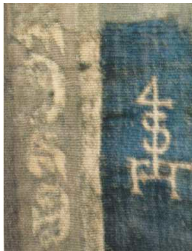
Fig.6. Monograma de François Tons en el tapiz de León a la orilla de un río