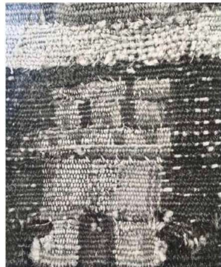
Fig. 5. Marca de la villa de Pastrana en el tapiz León a la orilla de un río